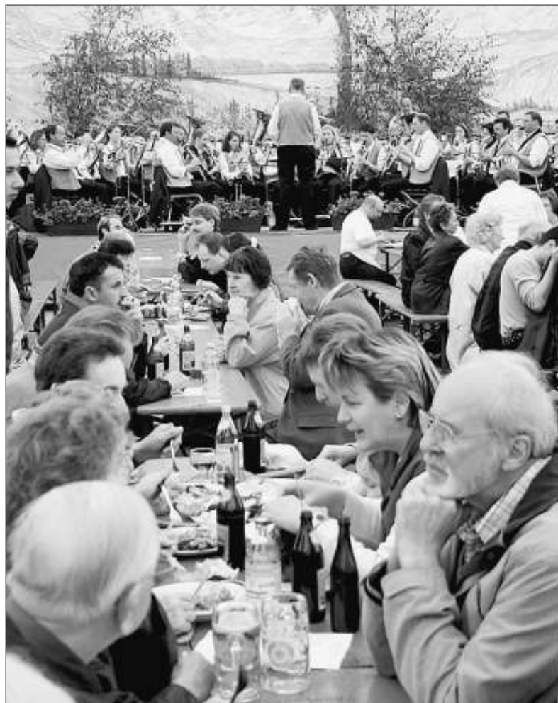
Gemütlich ging es zu im Festzelt beim Frühlingsfest in Stetten.