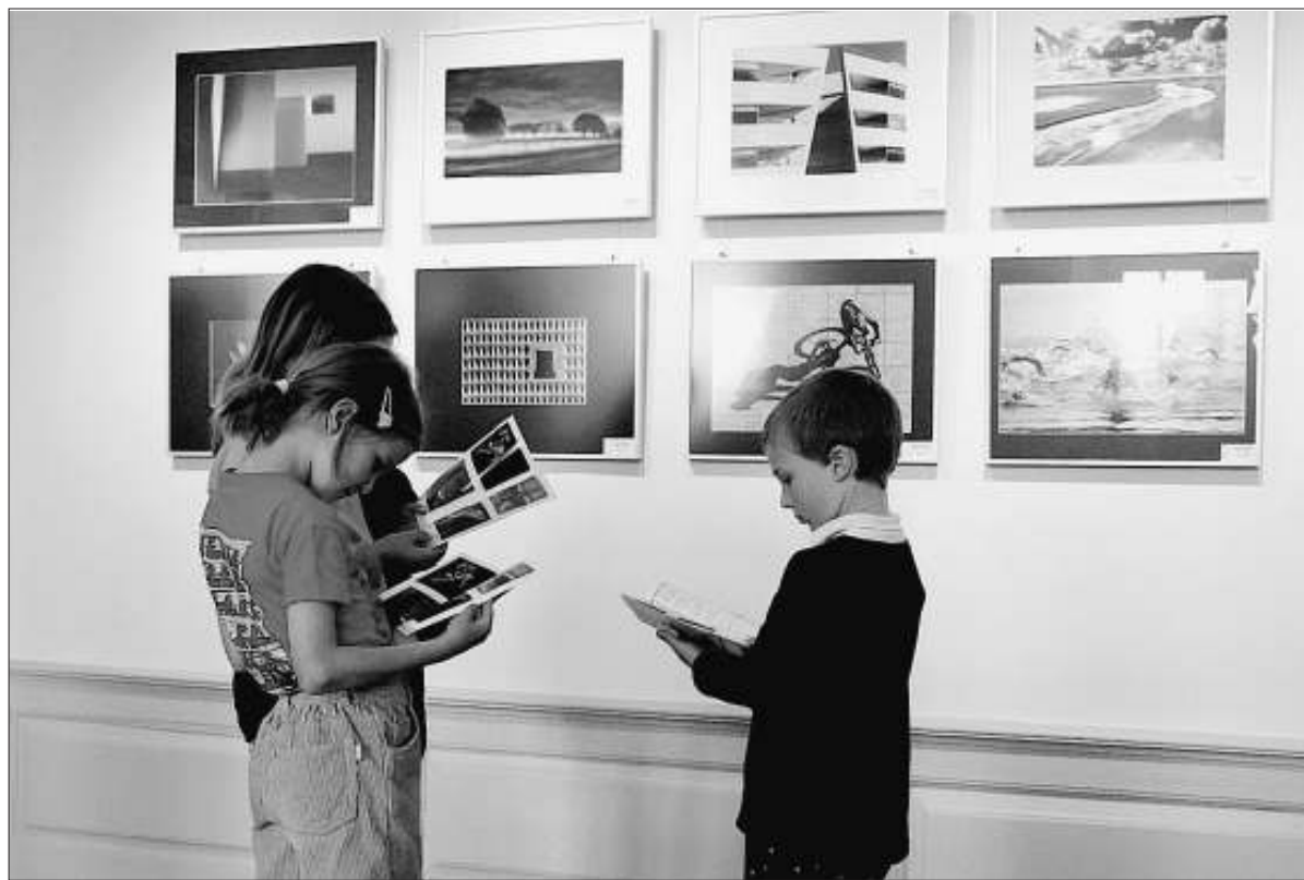
Eifrig Besucher: Auch die Kinder faszinieren die Fotografien bei der Landesausstellung.

Die in den würdigen Räumen des Schlosses ausgestellten Top-Fotos hielten internationalen Ansprüchen ohne weiteres Stand, lobte Reinhold Koch, der Landesverbandsvorsitzende des Deutschen Verbandes für Fotografie, das hohe Niveau der baden-württembergischen Amateurfotografen. Ohne das großartige Entgegenkom-